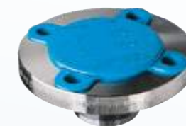
Série 150 lbs.