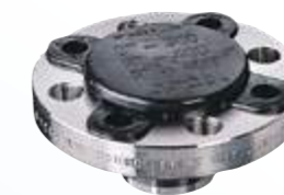
Série 300 lbs.